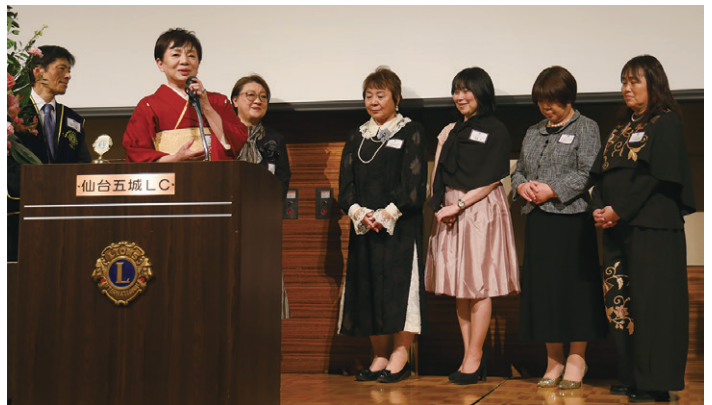
仙台ZUNDA ガールズ支部の皆様