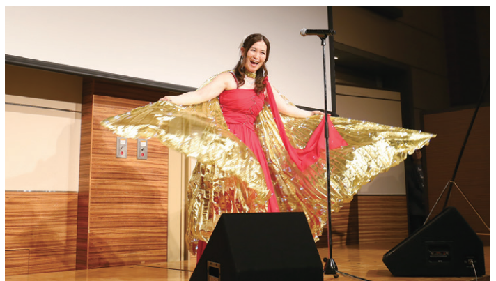
ティーナ・カリーナさんのアトラクション