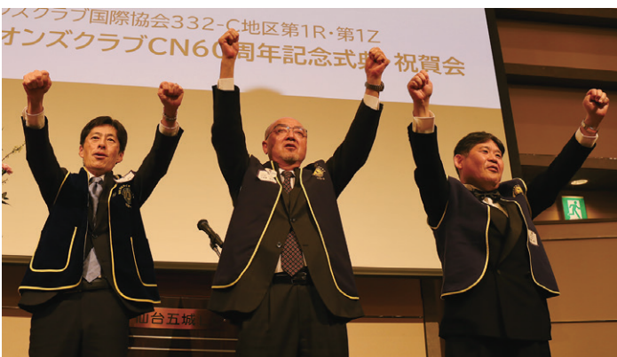
力強くライオンズローア