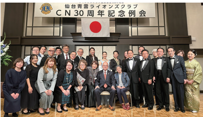
仙台青雲LCと仙台IMA支部一同