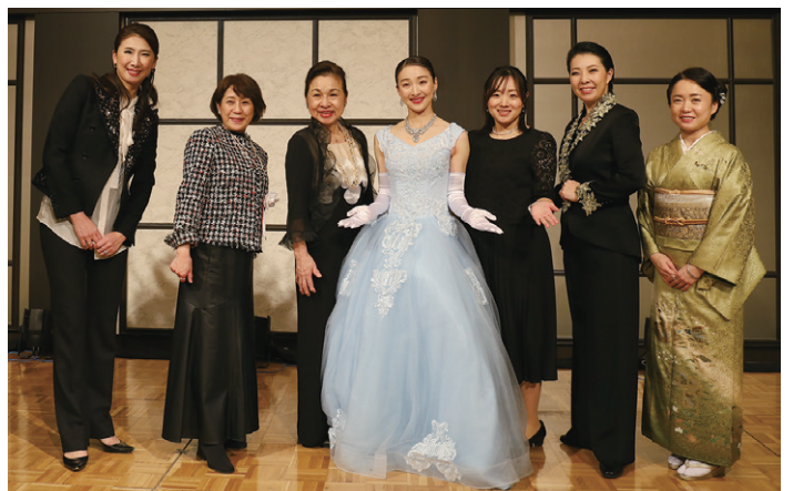
元宝塚3人の皆様にも能登半島豪雨災害募金支援にもご協力いただきました