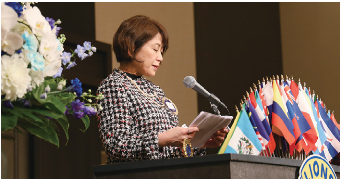
仙台青雲LC松岡会長の挨拶