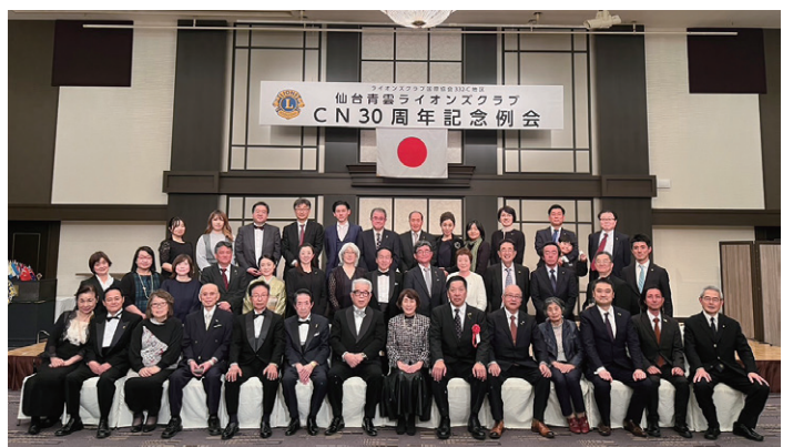
小松青雲LCの皆様と一緒に