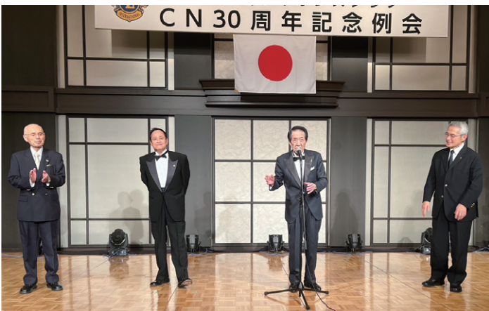
チャーターメンバーが集まりました