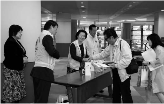
講演会場前の小児糖尿病サマーキャンプ支援募金活動

平成30年11月11日のドクターサーチみやぎ健康セミナー・宮城県糖尿病協会 市民公開講座に合わせて、講演会場の前に募金箱を設置し、小児糖尿病サマーキャンプ支援募金活動を実施いたしました。