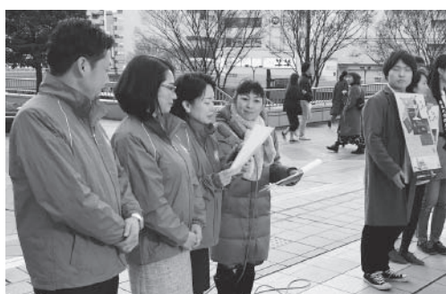
仙台駅前での番組収録風景

12月13日、ミヤギテレビ「OH!バンデス」の告知コーナーにて、当地区クラブの活動をPRしました。新しくテレビCM用として作成されたPR動画の放送と、青少年健全育成や、糖尿病対策支援事業など日頃の活動を紹介。2分10秒、限られた時間を頂いての紹介でしたが、ホームページ検索への誘導に繋がったのではないのでしょうか。寒空の下、原稿を間違えずに読む事だけにとらわれ、笑顔までには気が回らない出演者3人でしたが、またのご用命をお待ちしております。