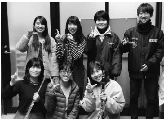
マレーシアからの来日生（前列中央）とレオクラブのメンバー