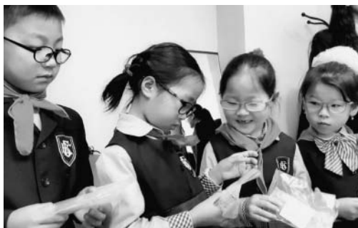
送られたリサイクル眼鏡をかけるモンゴルの子どもたち