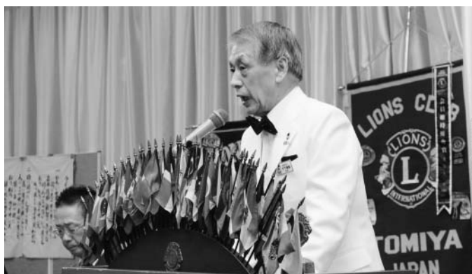
竹下ガバナーが熱い思いで今期の方針を語られました