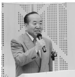
原田第一副地区ガバナーの挨拶