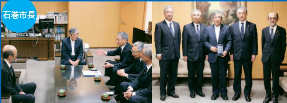
今後のライオンズの方向性をお話しました