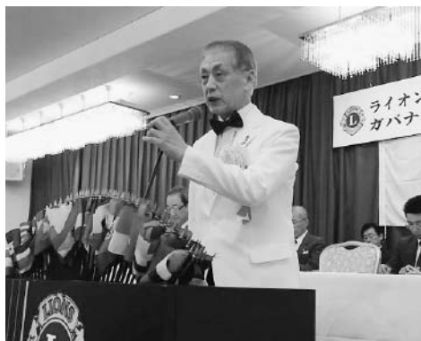
竹下ガバナーより今期の方針について