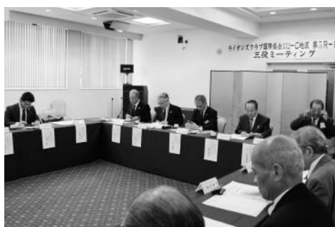
三役ミーティングの様子