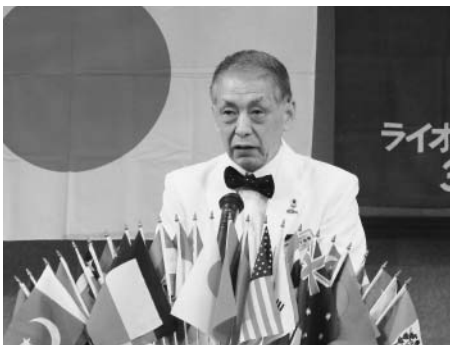
竹下ガバナーより今期の方針が語られました