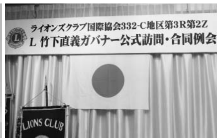
第一回目の公式訪問は 3R2Zから始まりました