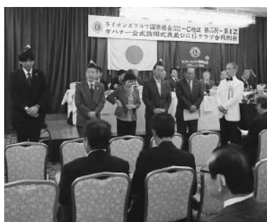
新入会員の入会式が行われました