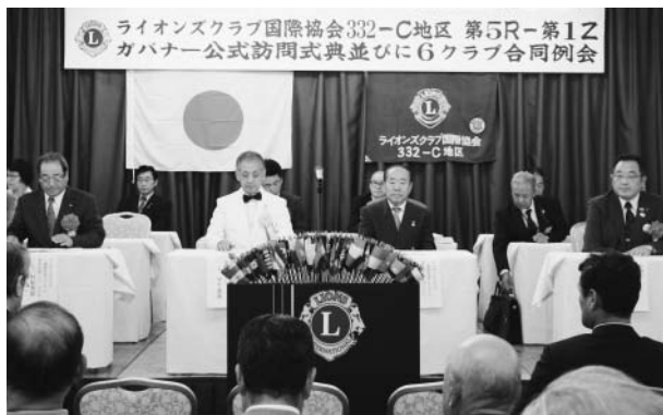
式典は厳粛に執り行われました