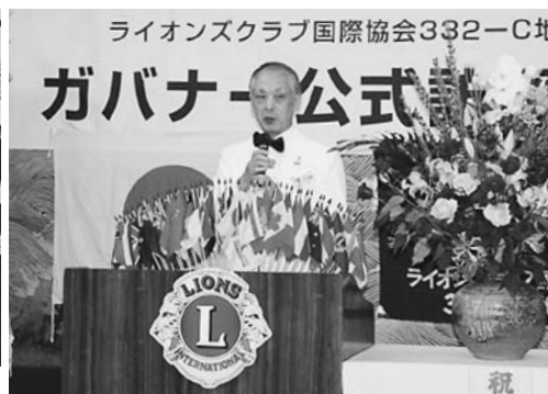
竹下ガバナーより地区方針が伝えられました