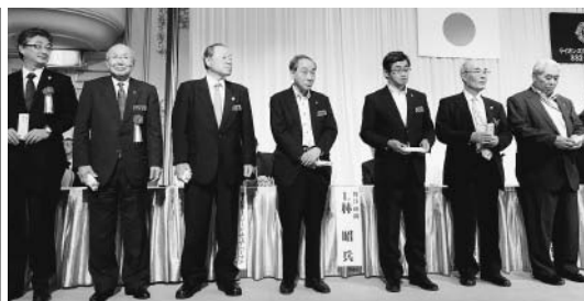
LCIF1,000ドル献金が多くなされました