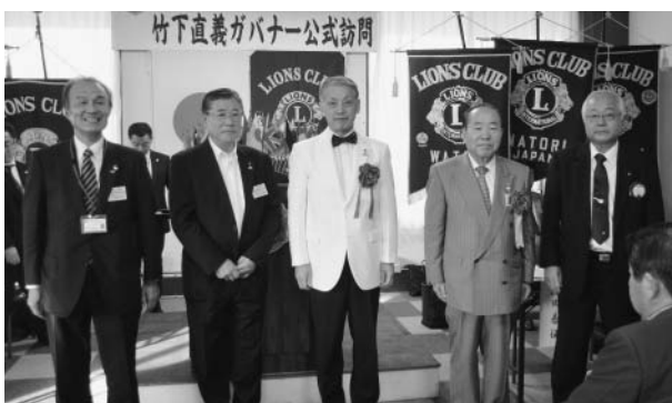
2R1Zの皆様「ありがとうございました」