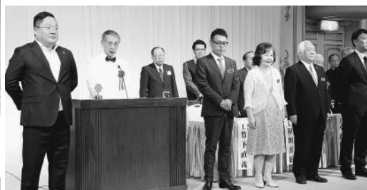
新入会員の入会式が執り行われました