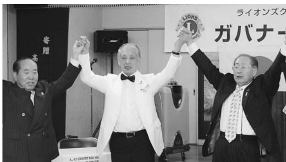
この日が最後の公式訪問でした。竹下ガバナーを始め キャビネットの皆様「ありがとうございました」