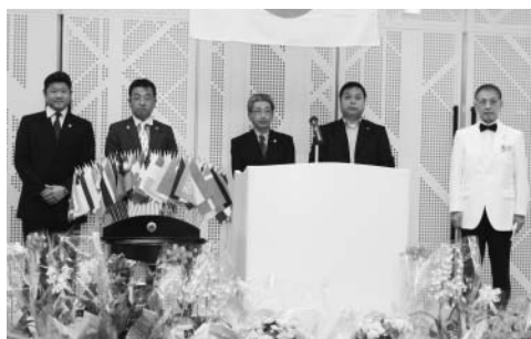
新入会員の入会式が行われました