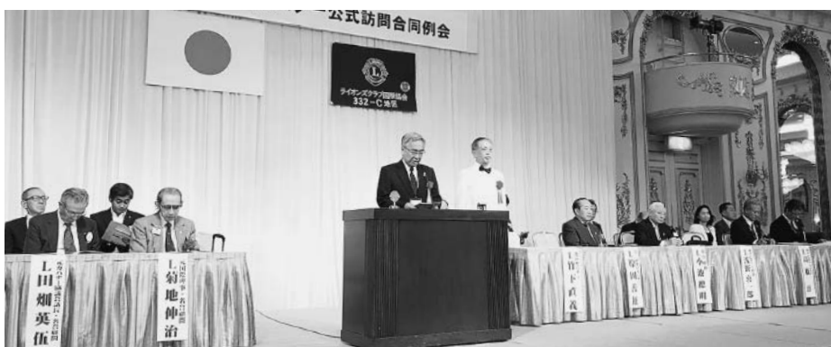
浅野キャビネット幹事による竹下ガバナーの紹介