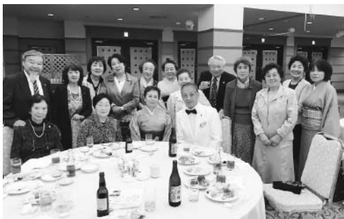
アゼリア支部の皆様と 「とても楽しいひと時となりました」