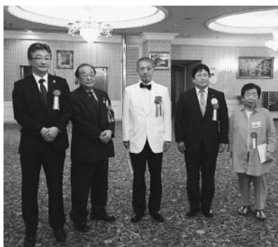
RC、ZCの皆様ありがとうございました