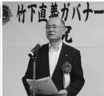
山元町 齋藤俊夫町長の挨拶