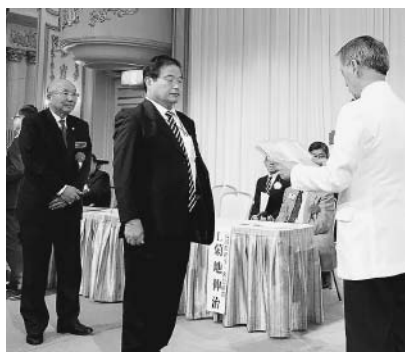
ゴールド100周年ライオンの表彰