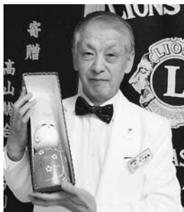
竹下ガバナーへ 嬉しいプレゼント