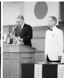
浅野キャビネット幹事より 竹下ガバナーの紹介