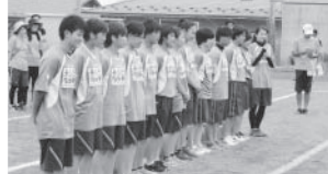
毎年、この大会を審判として支えてくれている常盤木高校女子サッカー部の皆さん

木町小学校女子サッカーチームの初優勝で終わり、賞状や金メダルが授与され、8位のチームまで表彰を受け、大会の幕を閉じました。好天に恵まれましたが、途中水分を補給しながら試合を続けた選手はもとより、大会主幹の先生方、審判を務めた常盤木サッカー部、最後まで応援を続けた父兄たちは汗だくの二日間でした。終わりに、また来年の参加を約束しながら散会しました。