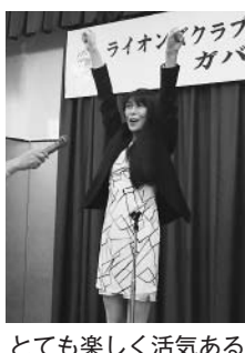
とても楽しく活気ある 祝宴となりました