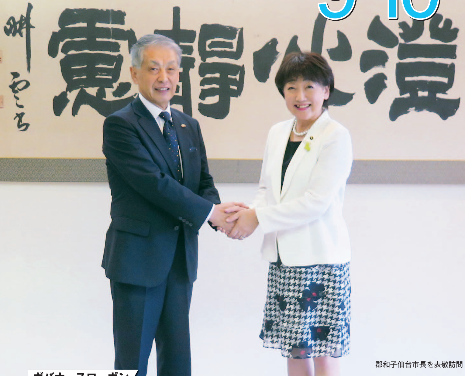
郡和子仙台市長を表敬訪問