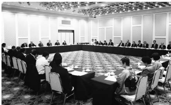
三役ミーティングの様子