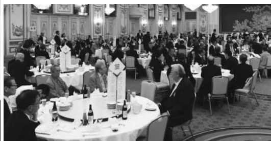
式典は盛大に執り行われました