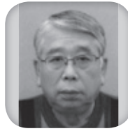
L.佐藤 茂 大和エコー 金額 50,000