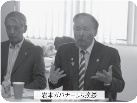
岩本ガバナーより挨拶