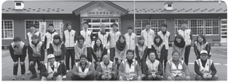
とても頑張ったレオクラブのアクティビティに地区のライオン達が「石巻焼きそば」などの炊き出しを行いました。アクティビティへの炊き出しという新しいアクティビティの形です。