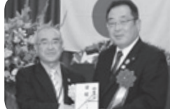
大崎市長へ・大崎市図書館へ 電子案内板・寄付

古川ライオンズクラブは、11月27日結成55周年記念式典を古川のグランド平成で開催しました。