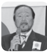
岩本ガバナーより ご祝辞