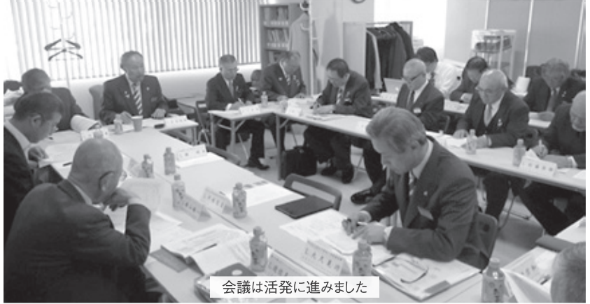
会議は活発に進みました