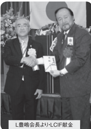
L豊嶋会長より・LCIF献金