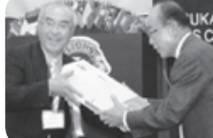
スポンサークラブへの 記念品贈呈