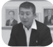
←笠原会員維持増強・エクステンション委員長より現状と方策の説明