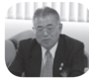
↑石川前ガバナーよりZCへのメッセージ