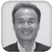
L.永富 淳次 名取 金額 100,000