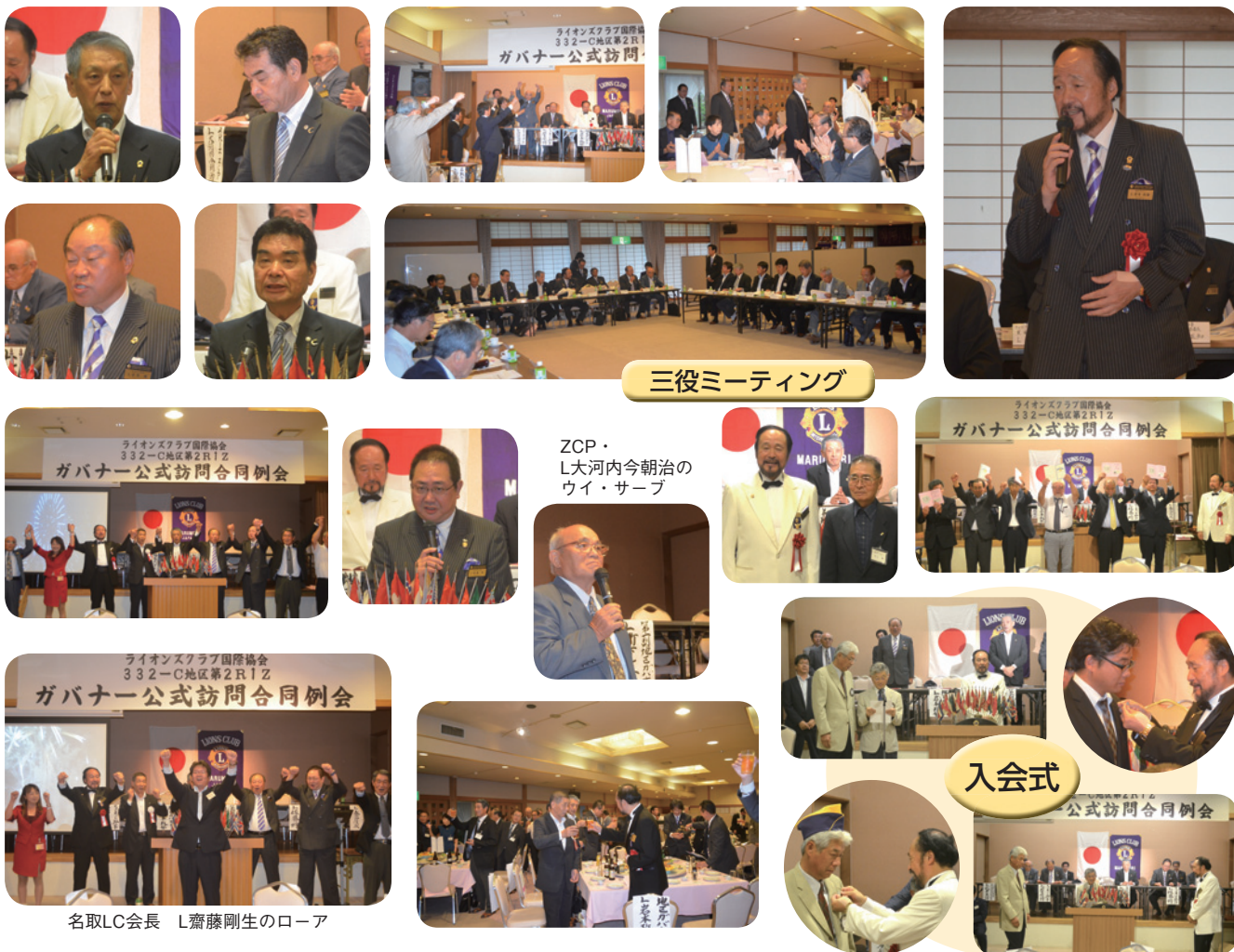
三役ミーティング

2R・1Z / 名取LC、亘理LC、岩沼LC、柴田LC、大河原LC、丸森LC、山元LC