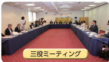
三役ミーティング