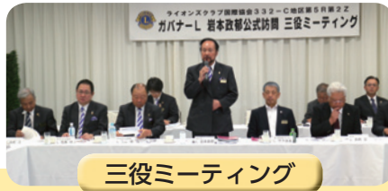
三役ミーティング