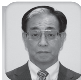
仙台エコー L C