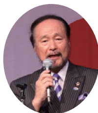
岩本ガバナー より挨拶