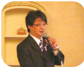
キャビネット執行部 武者ライオンの講話