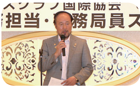
岩本ガバナーより挨拶