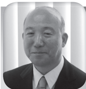
仙台五城 L C