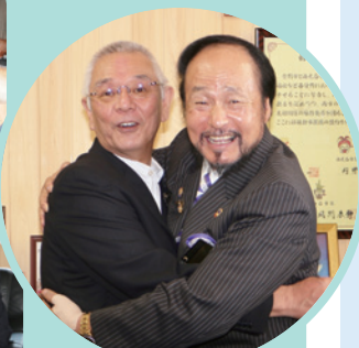
風間 康静 白石市長