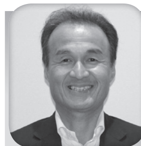
名取 L C