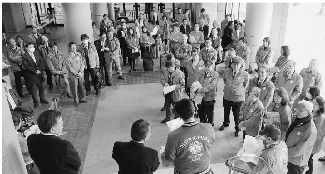
▲330A・332C合同ミーティング

ただ、フジコ・ヘミングさんは大変繊細な方です。無償での招待で来場される方の中にはコン