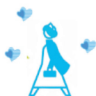
(一社) キャンナス東北