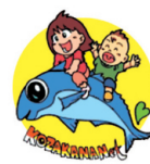
東日本大震災を乗り越える親子の記録 三陸ごごかなネット